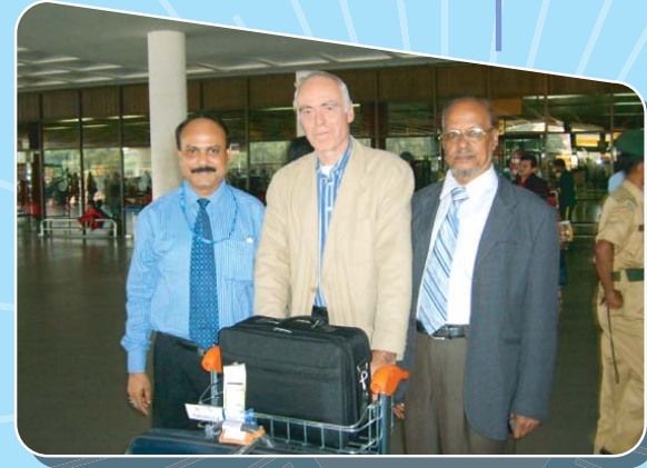
পরামর্শ-সেবা গ্রহীতা: রহিম স্টীল মিলস্ (প্রাঃ) লিঃ