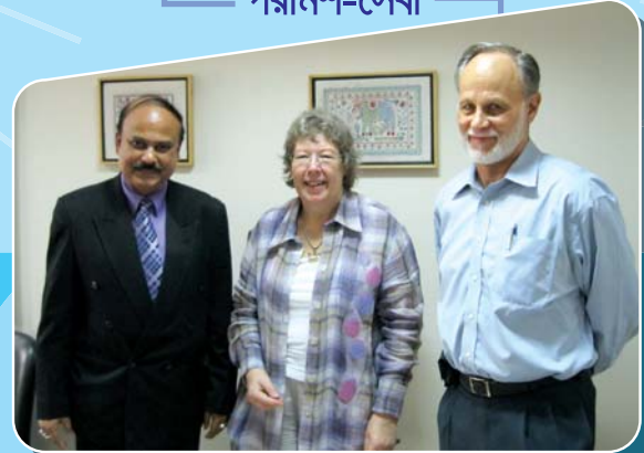
পরামর্শ-সেবা গ্রহীতা: ইম্পাহানি ইসলামিয়া চক্ষু ইনস্টিটিউট এন্ড হস্পিটল্