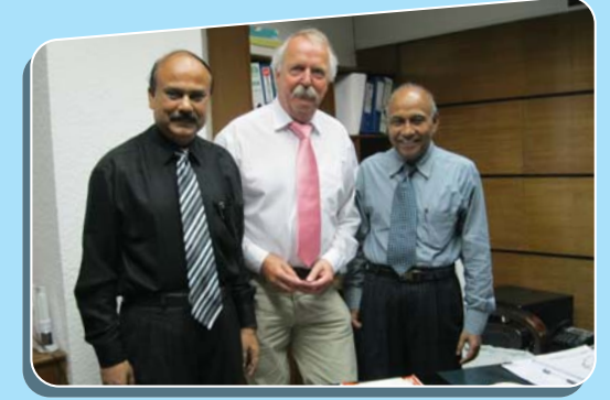
পরামর্শ-সেবা গ্রহীতা: প্রাইম ইন্সুরেন্স কোম্পানি লিঃ

দুই দশকেরও বেশী সময় ধরে পাম সিনিয়র এক্সপার্টগণ বিভিন্ন দেশে কারিগরি পরামর্শ দিয়ে আসছেন। তাঁদের মূল্যবান পরামর্শ অনুযায়ী পদক্ষেপ গ্রহণ করে শত শত প্রতিষ্ঠান লাভবান হয়েছে। পাম-নেদারল্যান্ডস্ প্রোগ্রামের অধীনে সাড়ে তিন হাজারের বেশী সিনিয়র এক্সপার্ট নিবন্ধিত আছেন। পাম-নেদারল্যান্ডস্ প্রোগ্রামের আওতায় প্রতিবছর প্রায় ১৬০০ সহায়তা প্রকল্প বাস্তবায়িত হয়ে থাকে। পরামর্শ-সেবা লাভের জন্য বিশেষ করে ক্ষুদ্র প্রতিষ্ঠানগুলো প্রাথমিক পরামর্শ সেবা পাওয়ার জন্য যোগ্য বলে বিবেচিত হয়ে আসছে। কিছু কিছু ক্ষেত্রে কোম্পানীর ব্যবস্থাপনায় নিয়োজিত কর্মীদের নেদারল্যান্ডে প্রশিক্ষণের সুযোগ দেওয়া হয়।