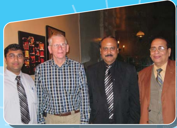
পরামর্শ-সেবা গ্রহীতা: বোম্বে এ্যাগ্রো লিঃ