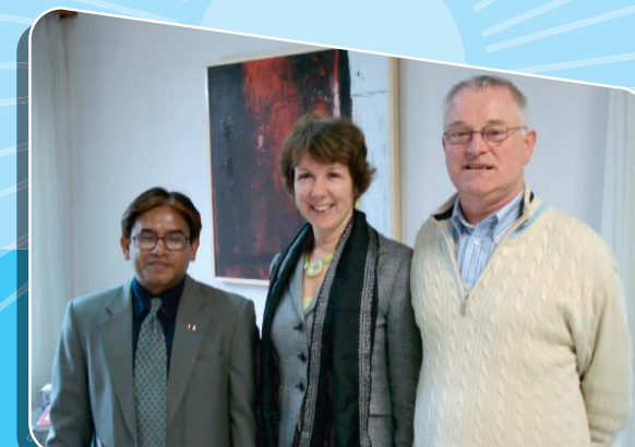
পরামর্শ-সেবা গ্রহীতা: ডি ই ডাব্লিউ

‘টেকনোলজি ট্রান্সফার ফর প্রাইভেট সেক্টর ডেভেলপমেন্ট প্রোগ্রাম’ অব মাইডাস