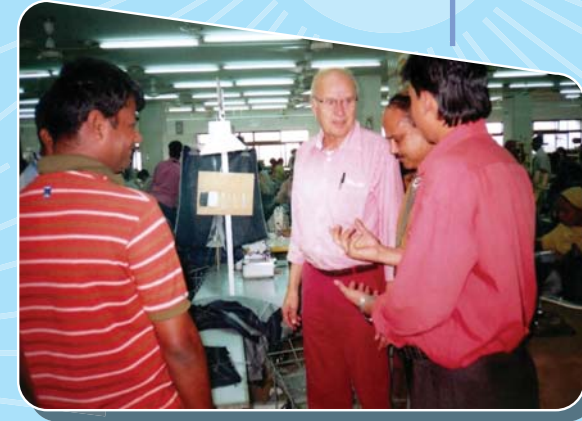
পরামর্শ-সেবা গ্রহীতা: ওয়্যার ম্যাগ লিঃ