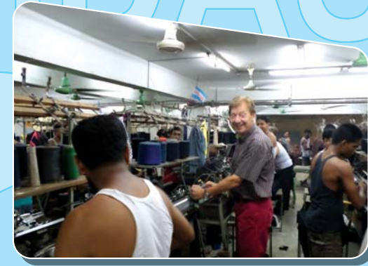
পরামর্শ-সেবা গ্রহীতা: কোরেক্স বাংলাদেশ লিঃ

এসব বিশেষজ্ঞ অতীতে নিজ নিজ কর্মজীবনে তাঁদের কোম্পানী ও প্রতিষ্ঠানসমূহের উন্নয়নের জন্য গুরুত্বপূর্ণ ভূমিকা রেখেছেন।