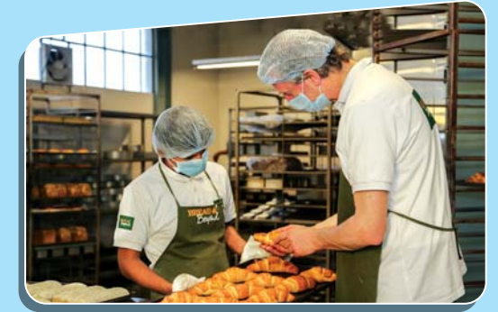
পরামর্শ-সেবা গ্রহীতা: ফুড এজ লিঃ

এছাড়াও ব্যবসায়িক সংযোগ (বিজনেস লিংক) প্রোগ্রামের মাধ্যমে স্থানীয় উদ্যোক্তাগণ ডাচ কোম্পানীর সাথে ব্যবসায়িক সম্পর্ক স্থাপনের সুযোগ লাভ করেন। যে সব দেশে পামের কার্যক্রম বিদ্যমান, সে সব দেশে বিভিন্ন সময় সেমিনার এবং প্রশিক্ষণের আয়োজন করা হয়।