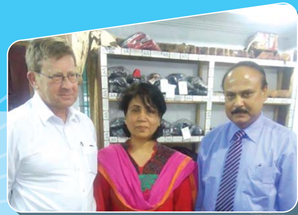
পরামর্শ-সেবা গ্রহীতা: এসিস্স লিঃ

পাম সিনিয়র এক্সপার্টদের সমস্ত আন্তর্জাতিক খরচ পাম-নেদারল্যান্ডস্ বহন করে। শুধুমাত্র তাঁদের স্থানীয়ভাবে সম্মানজনক বাসস্থান, খাওয়া, যাতায়াত এবং দৈনন্দিন প্রয়োজনীয় জিনিষের ব্যবস্থা পরামর্শ-সেবা গ্রহণকারী প্রতিষ্ঠানকে করতে হয়।