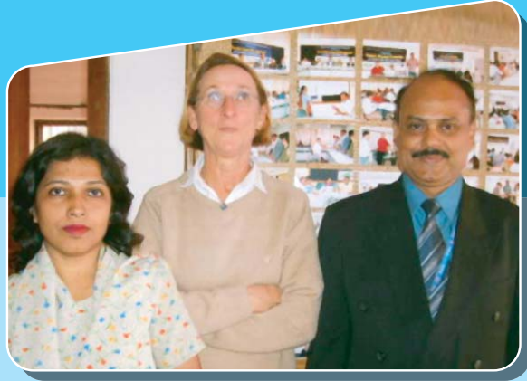
পরামর্শ-সেবা গ্রহীতা: একতা ফেয়ার ট্রেড লিঃ