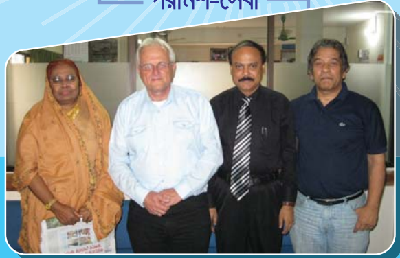
পরামর্শ-সেবা গ্রহীতা: টিএমএসএস মতস্য প্রকল্প, রাফাতুল্লাহ্ কমিউনিটি হস্পিটল্ এবং নারসিং কলেজ