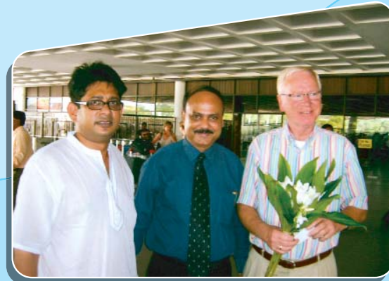
পরামর্শ-সেবা গ্রহীতা: ল্যান্ডমার্ক ফুটওয়্যার লিঃ

কাঠ শিল্প, হালকা ইঞ্জিনিয়ারিং শিল্প, মাশরুম চাষ, পোল্ট্রি ও পোল্ট্রি শিল্প, জুতা শিল্প, কৃষি ও উদ্যান বিদ্যার কৌশল, উদ্যান পালন - সবজি ও ফল, আবাদি কৃষি, গ্রীষ্মমন্ডলীয় কৃষি ও বৃক্ষ, ফুল ও শোভাবর্ধক বৃক্ষাদি, কৃষি ও উদ্যান পালনের প্রযুক্তি, ইমারত নির্মাণ শিল্প (ইমারত নির্মাণ উপকরণ ও সরবরাহ, ইমারত নকশাকরণ ও স্থাপত্য, যোগাযোগ ও ব্যবস্থাপনা), কাঁচ শিল্প ও মৃৎ শিল্প, শক্তি ও পানি এবং পরিবেশ শিল্প (শক্তি, পানি সরবরাহ ও বর্জ্য পানি পরিষ্কারকরণ, বর্জ্য ব্যবস্থাপনা, পরিবেশ সহায়ক বিষয়াদি), গো-প্রজনন এবং মৎস প্রজনন (গবাদি পশু প্রজনন, দুগ্ধজাত পণ্য প্রক্রিয়াকরণ, হাঁস-মুরগী প্রতিপালন, মৎস প্রজনন ও প্রক্রিয়াজাতকরণ, মৌমাছি পালন), প্রশিক্ষণ ও শিক্ষা (কারিগরি ও সাধারণ শিক্ষা) ইত্যাদি।